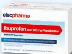
Ibuprofen 400 mg elac® 50 Filmtabletten € 6,95 PZN 19375754