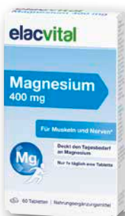
elacvital Magnesium 400 mg 60 Tabletten € 8,95 PZN 19212213