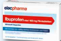
Ibuprofen 400 mg elac® 20 Filmtabletten € 2,95 PZN 19375725