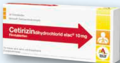
Cetirizin elac® 10 mg 20 Filmtabletten € 2,95 PZN 10979195