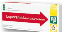
Loperamid elac® 2 mg 10 Tabletten € 2,95 PZN 236464