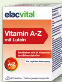
elacvital Vitamin A-Z mit Lutein 60 Tabletten € 8,95 PZN 19212242