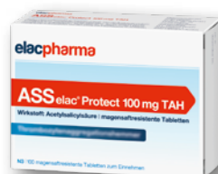
ASS elac® Protect 100 mg TAH 100 magensaftresistente Tabletten € 2,95 PZN 19249334