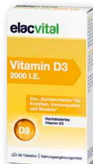
elacvital Vitamin D3 2000 I.E. 90 Tabletten € 5,95 PZN 19474887