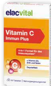
elacvital Vitamin C Immun Plus 30 Stück € 5,95 PZN 19490372