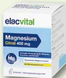
elacvital Magnesium Citrat 400 mg 20 Beutel € 9,95 PZN 19229484