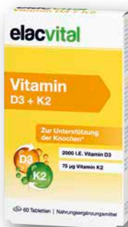
elacvital Vitamin D3 + K2 60 Tabletten € 10,45 PZN 19222648