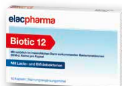
elacpharma Biotic 12 10 Kapseln € 14,95 PZN 19656743