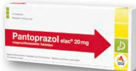
Pantoprazol elac® 20 mg 14 Tabletten € 5,95 PZN 10021871