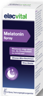
elacvital Melatonin Spray 30 ml € 7,95 1 l = € 266,33 PZN 19394898