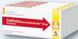
Cetirizin elac® 10 mg 5 x 20 Filmtabletten € 12,95 PZN 10979203