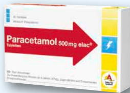
Paracetamol 500 mg elac® 20 Tabletten € 1,75 PZN 16762628