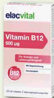
elacvital Vitamin B12 500 µg 90 Tabletten € 15,95 PZN 19222654